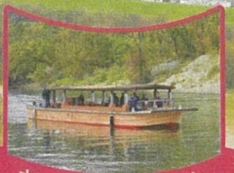
さくらであいクルーズ

パーク&ライドの推進に取り組んでいます。 背割堤さくらまつりでは、道路混雑の緩和や、環境負荷の軽減、公共交通の利用促進を図るため、パーク&ライドを推進しています。 詳細はホームページをご覧ください。