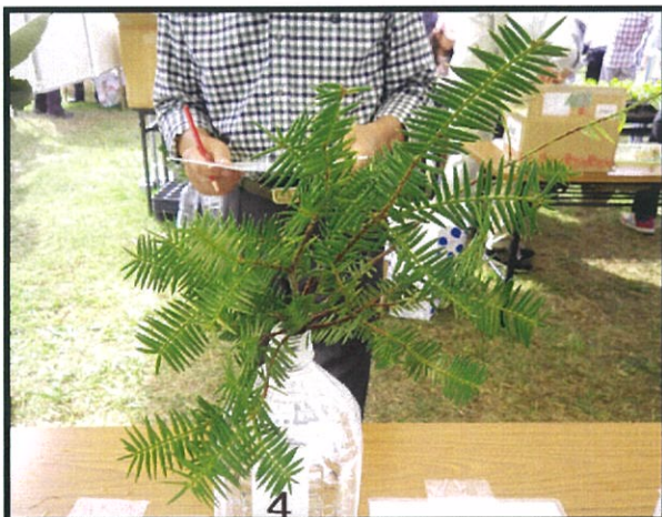
④：た（カヤノキ・カヤ）