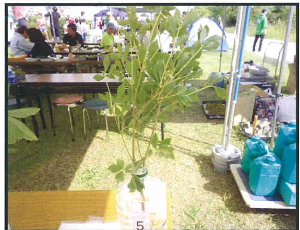
⑤：つ（ドウダンツツジ）