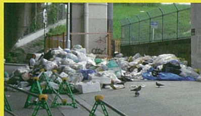
市街地に投棄されたバーベキューゴミ

バーベキュー利用者による大量のゴミが発生していること、一部は市街地へ投棄され住民の皆様のご迷惑になっていることから、バーベキューを有料化し、ゴミを淀川公園内で回収、処分する費用に充てる事業を今年秋から試行する予定です。これにより、河川環境や近隣の住環境保全に役立てます。ご理解とご協力をよろしくお願いいたします。