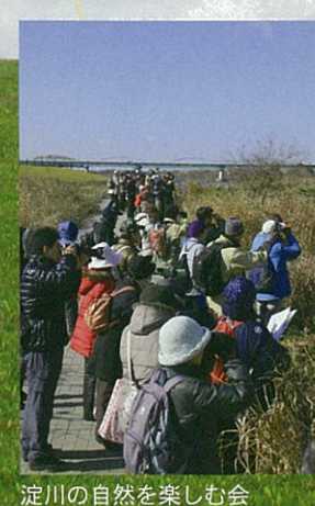
淀川の自然を楽しむ会