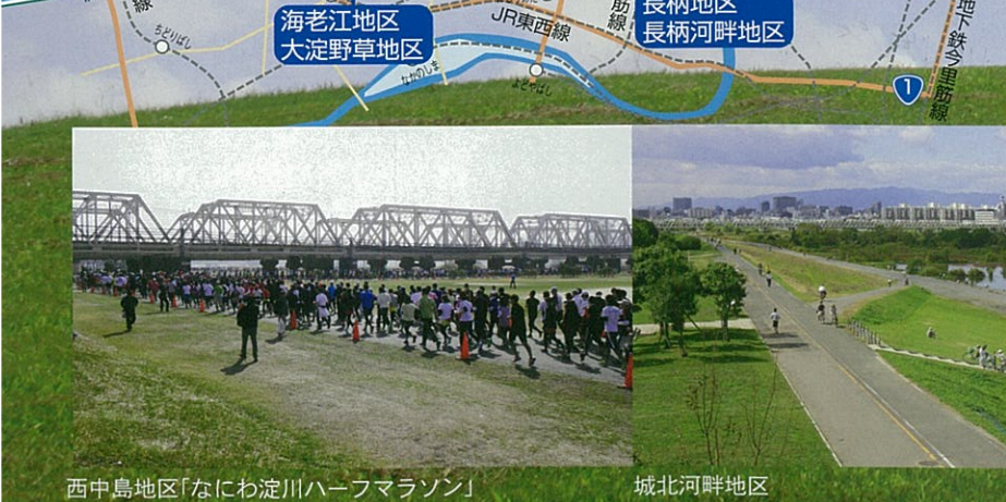
西中島地区「なにな淀川ハーフマラソン」